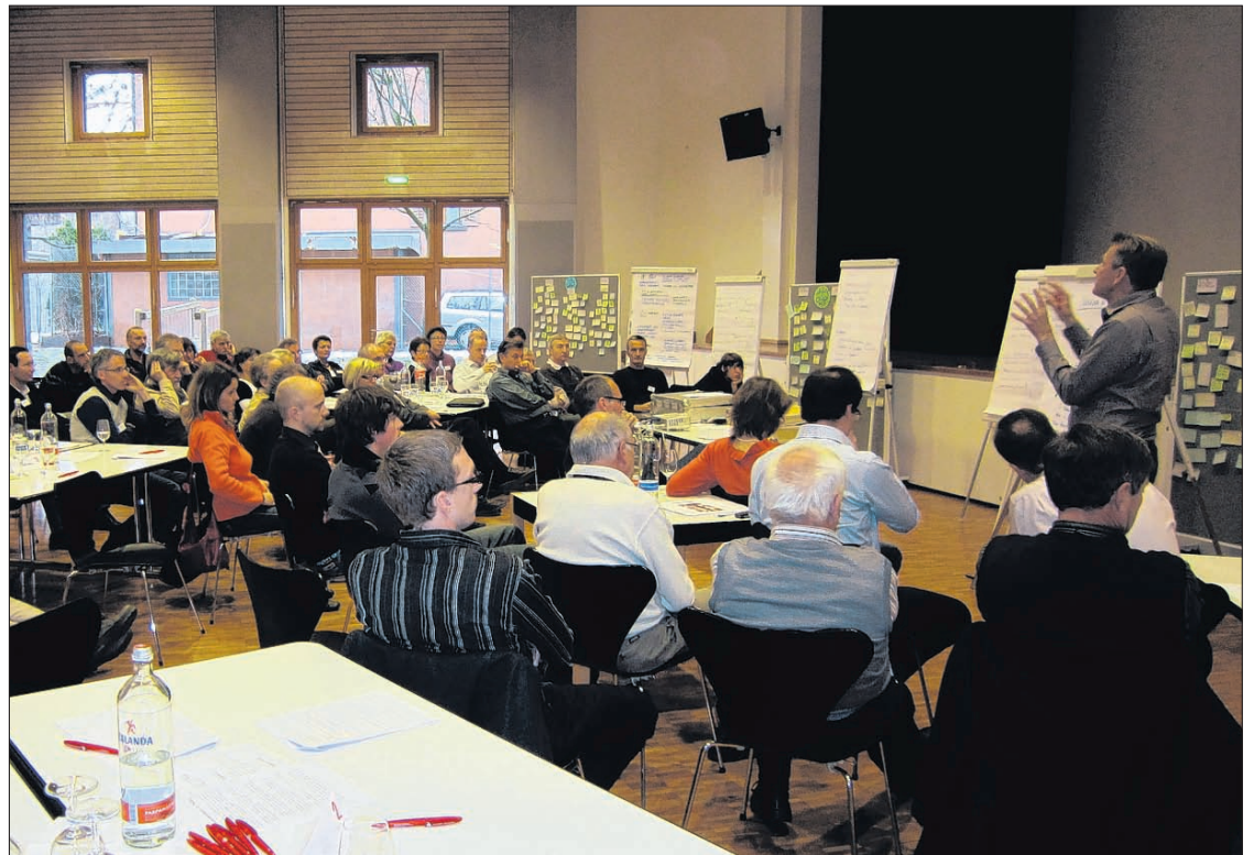
Zukunftskonferenz als partizipativer Planungsprozess.

Praktisch aus allen Bevölkerungsgruppen erschienen am Freitagnachmittag über 50 Zukunftsinteressierte in der Mehrzweckhalle zur sechsphasigen Zukunftskonferenz über den Verkehr in Domat/Ems. Sieben Gruppen starteten mit dem Rückblick in die Vergangenheit und zwar aus persönlicher Perspektive, aus nationaler Sicht sowie spezifisch hinsichtlich der Verkehrssituation in Ems. Schon bald spürten alle die Vielseitigkeit der individuell erlebten Vergangenheit. In völlig neu durchmischten Gruppen galt es danach, den aktuell empfundenen