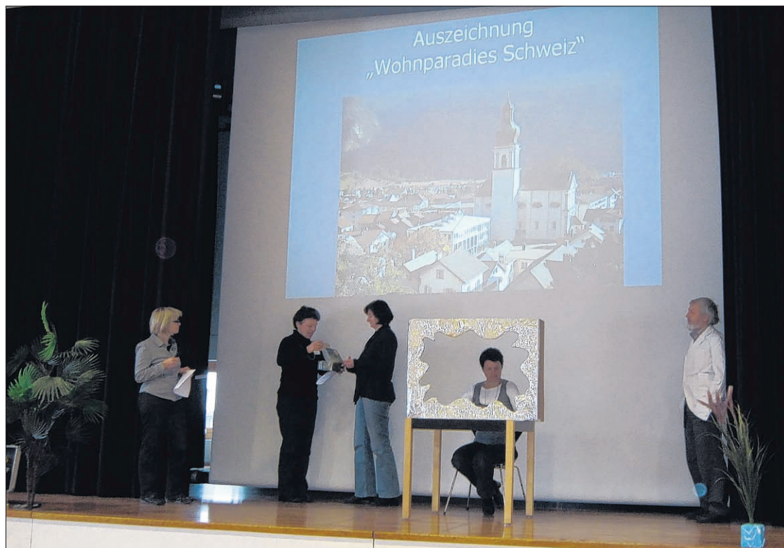
Theaterstück aus dem Zeitsprung 2040: Auszeichnung von Domat/Ems als «Wohnparadies Schweiz» in der Sendung «12vor12».

Alle in den Theaterstücken beobachteten Visionen wurden von den Zuschauern sorgfältig notiert, denn diese bildeten die Grundlage für die Ernte der Zukunftskonferenz. So machte es die Vielfalt der kreativen Ideen schwierig, den Weg aus der Zukunft wieder zurück in die Gegenwart zu finden. Für die Herausarbeitung der Ergebnisse wurden wiederum in der Gruppe die unterschiedlich wahrgenommenen Visionen sortiert und auf einem «Zukunftstreifen» stichwortartig aufgeschrieben. Anschliessend galt es im Ple-