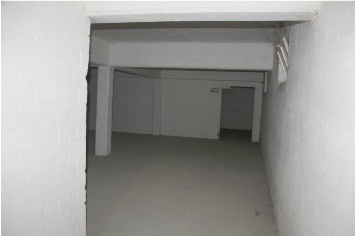
Abbildung 3: Kellerräume im Unterschoss