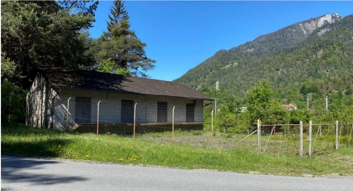
Abbildung 1: Ostansicht altes Munitionsdepot mit Stacheldrahtumzäunung auf der Parzellengrenze

Das Lagergebäude ist weder am Stromnetz angeschlossen noch verfügt es über Wasser- bzw. Abwasseranschlüsse. Bei Bedarf könnte jedoch eine Stromzufuhr kostengünstig realisiert werden, ein Anschlusspunkt wäre in der Nähe (rund 30 m entfernt). Ein Netzanschluss für eine einfache Raumbelichtung wäre sinnvoll. Der rostige hohe Stacheldrahtzaun ist zu entfernen und ist für die Lagerzwecke der Gemeinde auch nicht mehr nötig. Stacheldrahtzäune sind auf dem Gemeindegebiet grundsätzlich verboten (Art. 69 Abs. 2 Baugesetz).