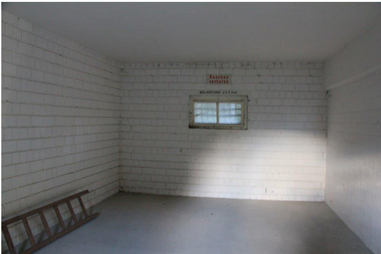
Abbildung 2: Raumböxe (total 4 Stück) im Erdgeschoss